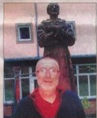
Huit années d'études chez les pères capucins racontées avec humour et tendresse.